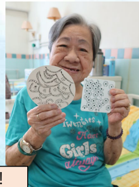
長者開心畫禪繞畫，她們的作品好精緻呀！