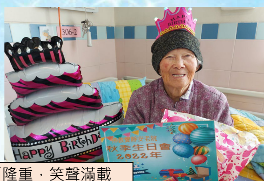
與長者慶祝生日，小而隆重，笑聲滿載