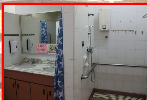
裝修前的院友浴室