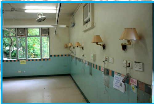
裝修前的院友房間