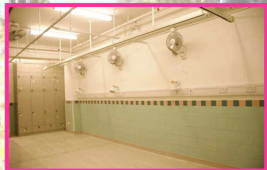
裝修後的院友房間