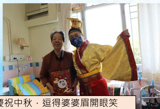
同事們扮鬼扮馬，與院友一齊慶祝中秋，逗得婆婆眉開眼笑