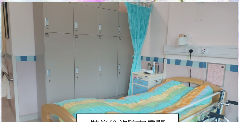
裝修後的院友房間