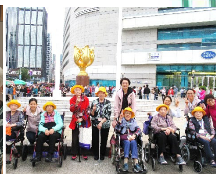
蓮社 73 週年社慶，我們的院友一同慶賀，院友們吃飯之前還順道參觀了金紫荊廣場呢。