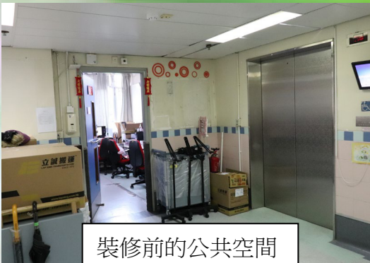
裝修前的公共空間

跟進本院大裝修的情況，三樓的翻新工程在 8 月已順利完成。讓我們比對一下三樓裝修前後的轉變。