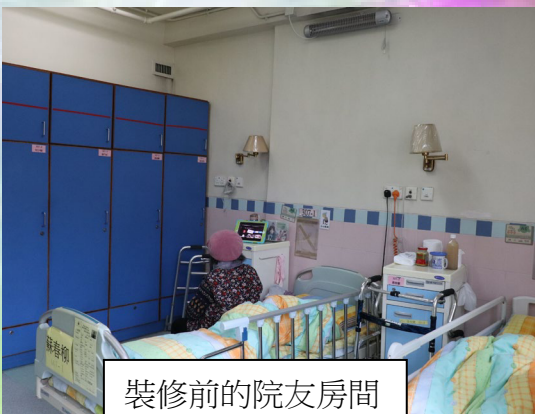
裝修前的院友房間