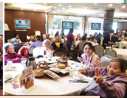
去雲泉仙館、行商場、飲茶這些外遊活動，又怎能少得我們的長者呢？