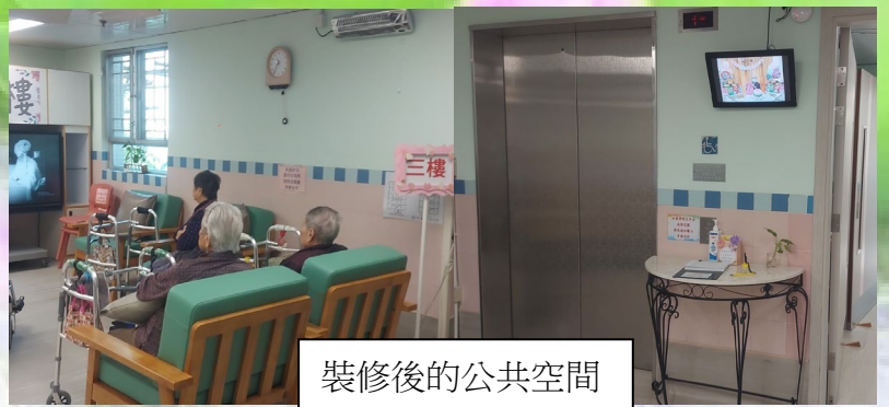
裝修後的公共空間