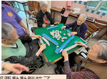
長者們正在玩大富翁、撲克和麻雀，大家都要動動腦筋了。