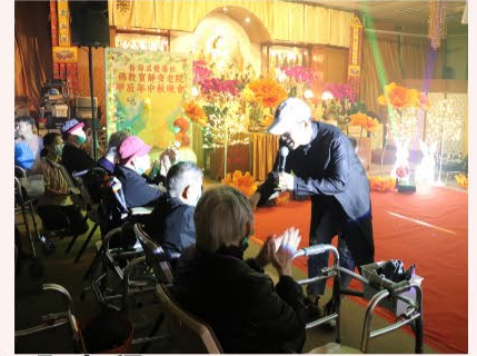
中秋晚會十分熱鬧，院友們玩得十分盡興。