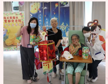
中秋節當日本院為長者們舉行慶祝活動，玩遊戲，抽利是，頒花燈設計比賽的獎項，熱鬧之餘也十分溫馨。