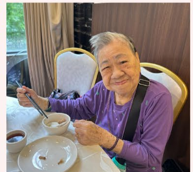
長者活動又怎麼少得外出飲茶的活動，長者們最喜歡點一盅兩件，慢慢品茗，享受人生。