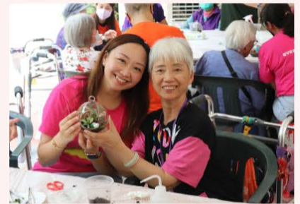
義工們到院舍與長者一同製作小盆景，樂也融融。