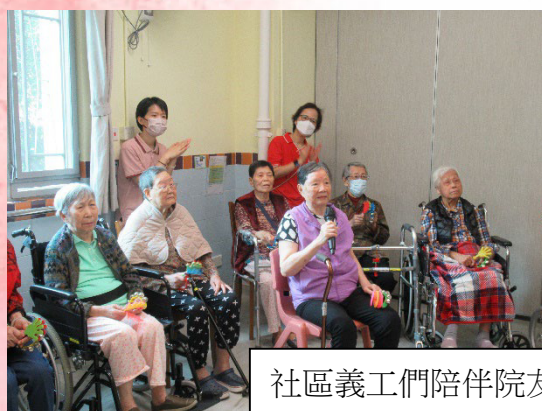
社區義工們陪伴院友們參與多種活動，例如唱卡拉 OK、玩硬地滾球等。