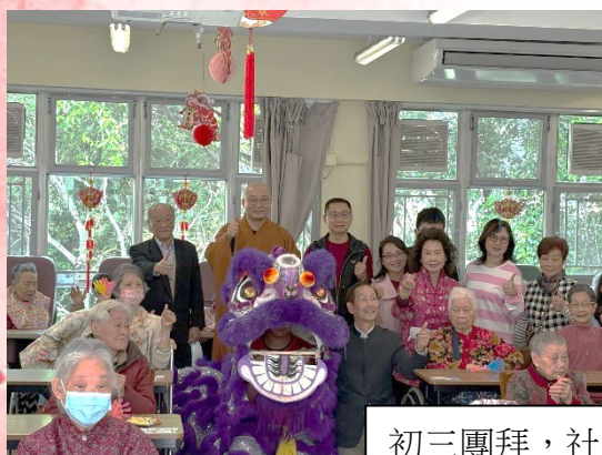
初三團拜，社長同院友拜年。