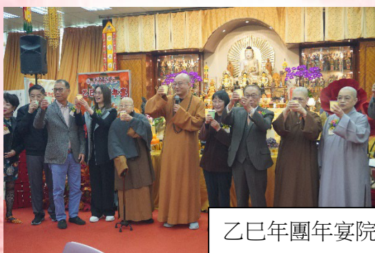
乙巳年團年宴院友嘉賓一同團團圓圓。