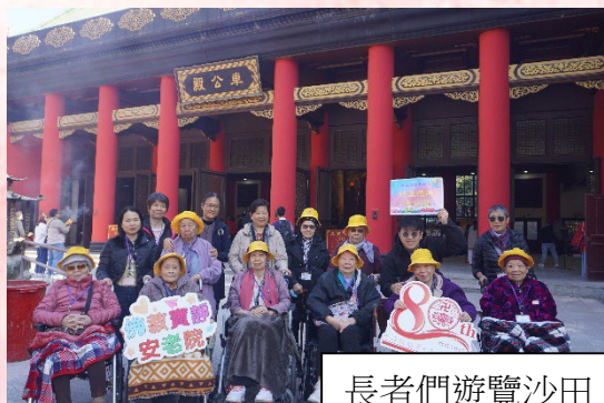
長者們遊覽沙田，去車公廟參拜。